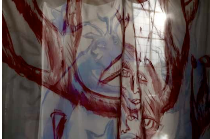
Espace d'art contemporain Tem de Goviller (54) : robe de mariée géante (2016)